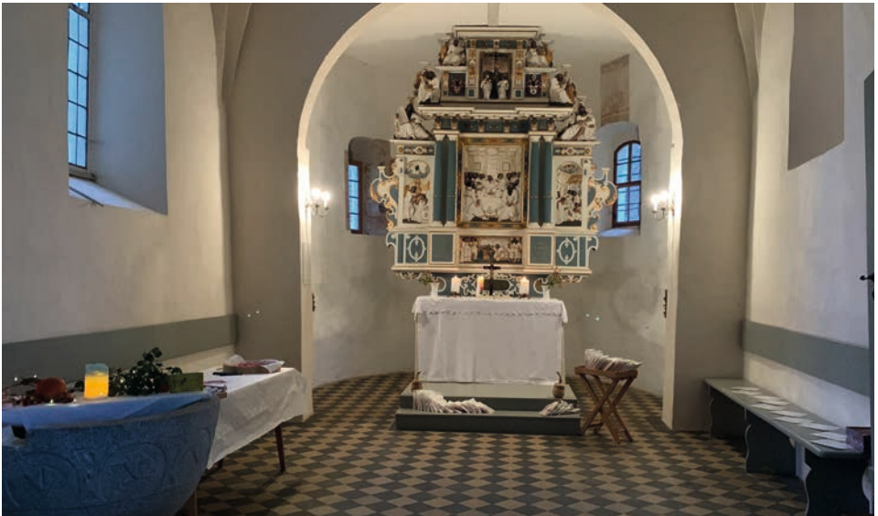
31.10.23 in Dautzschen