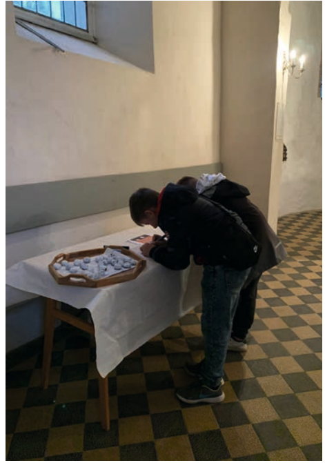
31.10.23 in Dautzschen