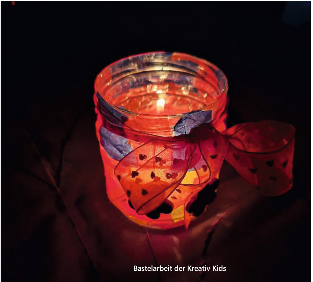
Bastelarbeit der Kreativ Kids

Gemeindebrief für den Ev. Pfarrbereich Annaburg | Klöden | Prettin