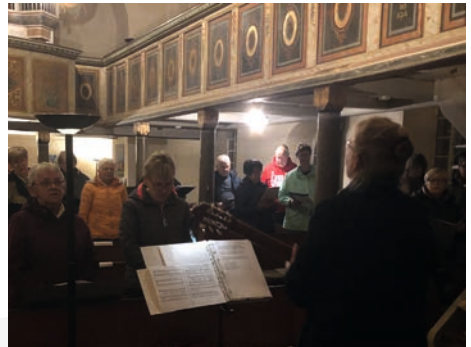
Probe in Axien

Es ist toll, dass die Chorsängerinnen und Sänger - wenn auch nicht immer alle – so