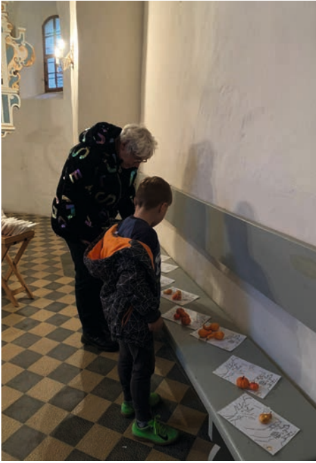
31.10.23 in Dautzschen