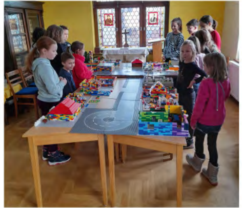
Traumstadt in Möhra