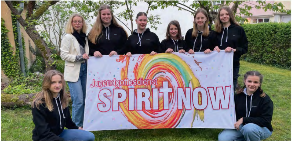
Die Jugendlichen im Kirchenkreis Bad Salzungen-Dermbach