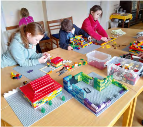
Baumeister in Möhra