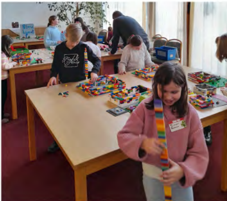
LEGO®-Tag in Bad Salzungen