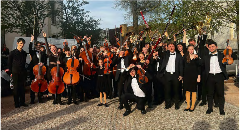
Das Landesjugendorchester Thüringen vor der Stadtkirche St. Simplicius