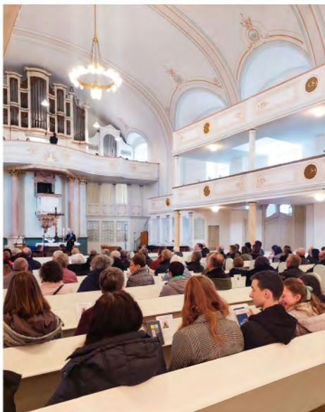
Radio-Gottesdienst am Karfreitag

Rund 165 Besucher kamen am Karfreitag, den 29. März, in die Stadtkirche um die Live-Übertragung des Radio-Gottesdienstes in Bad Salzungen zu erleben. Der Karfreitagsgottesdienst, der von der ökumenischen Stadtkantorei und dem Ambulanten Hospizdienst Bad Salzungen/Rhön mitgestaltet wurde, behandelte die schweren Themen Kreuz, Tod und Leid. Besonders im Fokus standen dabei der tiefe Trost und die großen Hoffnungen, die auch in schweren Lebenssituationen Kraft geben können.