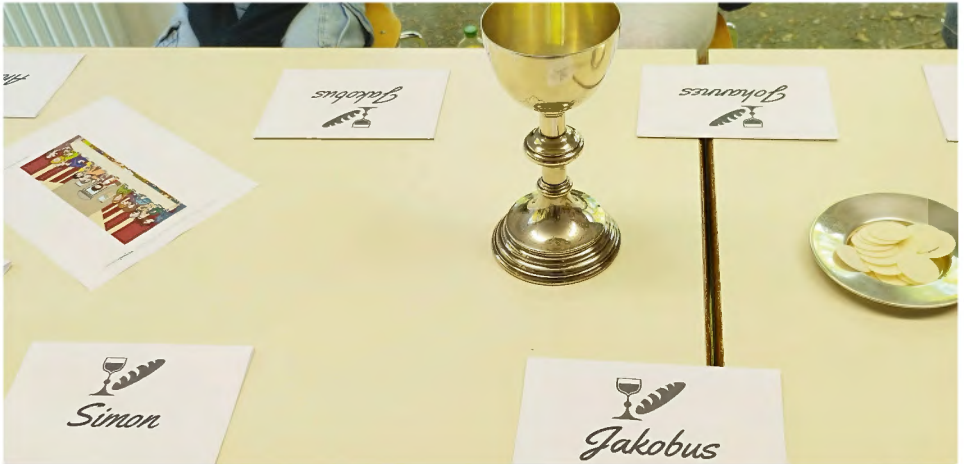
Zu Tisch als Jünger