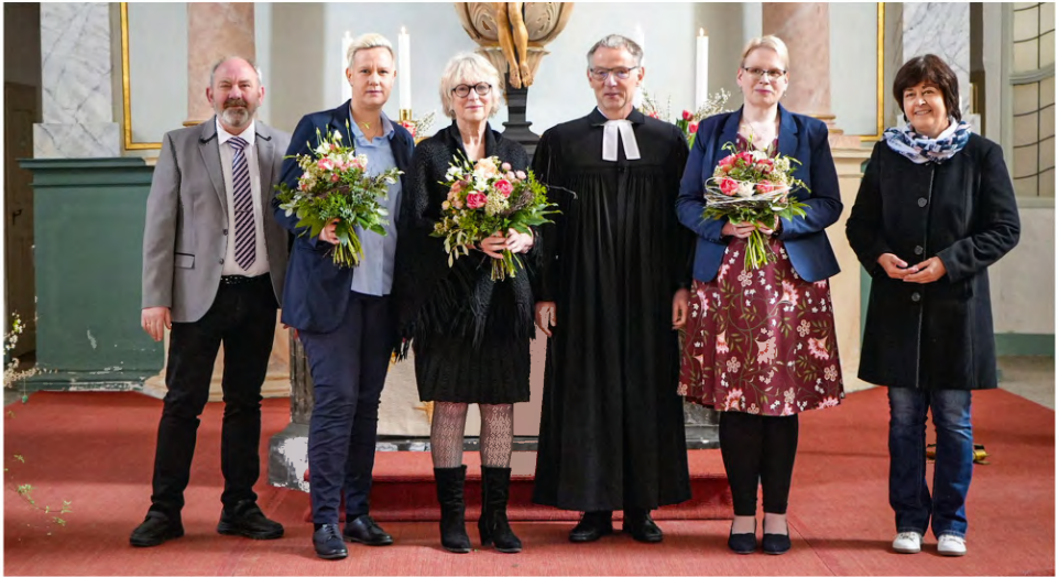
Begrüßung der neuen Mitarbeiterinnen in der Stadtkirche